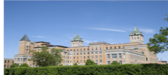
Hôpital du Saint-Sacrement