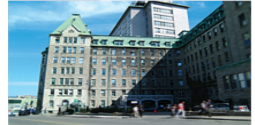
L'Hôtel-Dieu de Québec