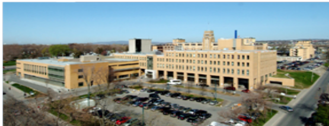
Hôpital de l'Enfant-Jésus