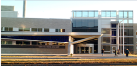
Centre hospitalier de l'Université Laval