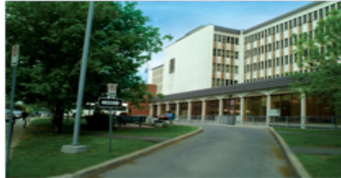
Hôpital Saint-François d'Assise